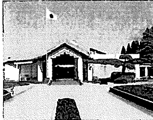
知覧 特攻平和会館