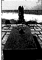
比島戦没者慰霊の碑