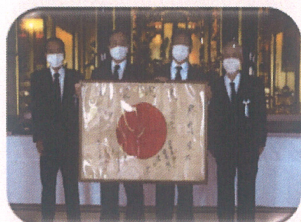
戦没者の遺留品返還(妙高市)