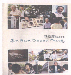
座談会(大阪市東成区)

世界に目を向ければ、ロシアのウクライナ侵攻をはじめ、各地で争いは絶えることなく、罪のない命が奪われています。戦後生まれが大多数となった今日、戦争体験者の遺族のお話を聞いて、改めて戦争と平和について考えてみませんか？