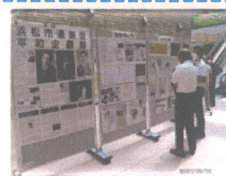
写真パネル展示(浜松市)