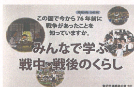
絵本の配布(金沢市)